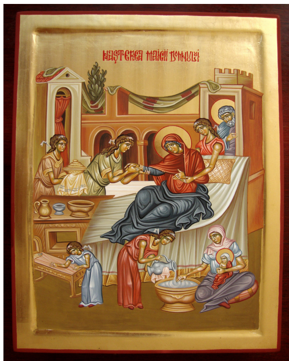
Nașterea Maicii Domnului